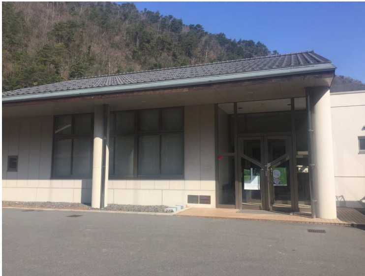
岡山県苫田郡鏡野町井坂495 鏡野町有線テレビ